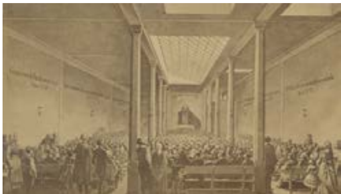
Iglesia de Jesús de la IEE (finales s.XIX)

Por su parte, también la más que centenaria Facultad de Teología SEUT, tiene tras de sí toda una vocación por la formación y la enseñanza de la Teología y la Biblia. Su historia se retrotrae a 1884 y se vincula también a la Iglesia Evangélica Española.