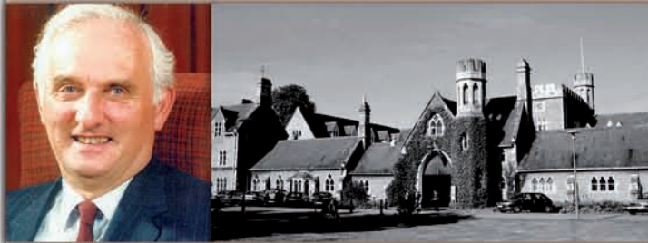
Sir John Houghton Universidad de Gloucestershire, sede del John Ray Initiative

Anteriormente, Sir John Houghton fue catedrático de Física Atmosférica de la Universidad de Oxford (1976-83), director general (posteriormente jefe ejecutivo) de la Oficina Meteorológica del Reino Unido (1983-91), presidente de la Comisión Real Británica sobre Contaminación Ambiental (1992-98) y miembro del Panel Gubernamental sobre Desarrollo Sostenible del Reino Unido (1994-2000).