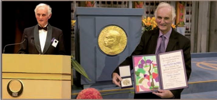
Premio de Japón, 2006 Premio Nobel, 2007

Además de de ser el editor principal de los tres primeros informes científicos del IPCC (1990/1992, 1995 y 2001), es autor de publicaciones científicas como: The Physics of Atmospheres (1977, 1986, 2002) y Global Warming: the Complete Briefing (1994, 1997, 2004, 2009). Sus reflexiones sobre ciencia y fe han sido publicadas en: Does God Play Dice? (1988) y The search for God, can science help? (1995, 2007).