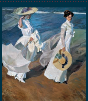
JOAQUÍN SOROLLA PASEO A LA ORILLA DEL MAR, 1909. MUSEO SOROLLA.

(C/ Galileo, 39) – Tf.: 91 5913901. Aforo: 53 puestos. De lunes a domingo, de 8:00 a 21:00 h, ininterrumpidamente. ACCESO POR ORDEN DE LLEGADA HASTA COMPLETAR AFORO.