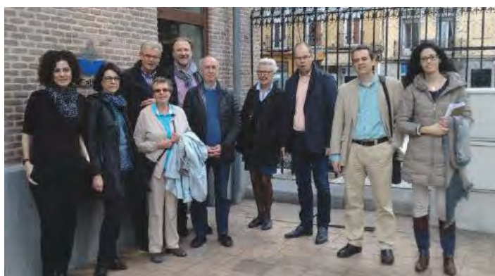
Reunión anual del Verein en Madrid (abril 2016)

A incrementar los fondos destinados a las Becas Fliedner que el propio esfuerzo presupuestario anual de la Fundación prevé, está destinado un programa especial de captación de fondos. Éste es financiado a través de donativos de personas particulares , así como mediante donativos de entidades privadas que anualmente aportan al programa de becas de la