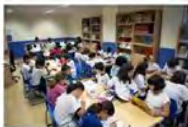
Biblioteca de Primaria El Porvenir