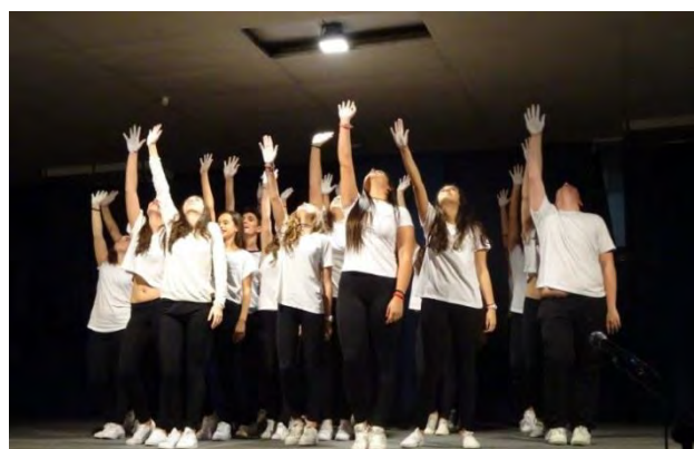
Coro de las emociones en 4º ESO