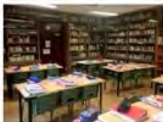
Biblioteca de Secundaria El Porvenir

En Juan de Valdés , el espacio de la Biblioteca escolar se usa también como recurso para potenciar la relación entre los alumnos más mayores y los más pequeños. El “Cuentacuentos”, actividad realizada con motivo del Día del Libro y en la que los alumnos de secundaria cuentan cuentos a los más pequeños, es buena muestra de ello.