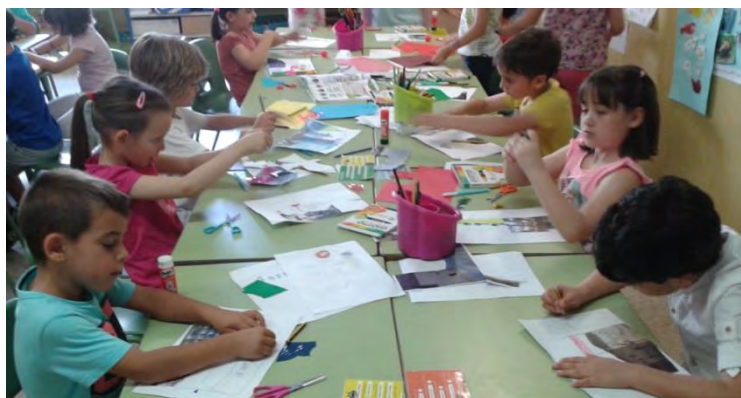
ReflejArte en Primaria

En Juan de Valdés, el aprendizaje social y emocional a través del proyecto de Educación Responsable de la Fundación Botín, se trabaja a partir de diversas actividades que se implantan y ajustan a cada una de las etapas educativas, tales como el “ Coro de las Emociones ”, “ Literatura y Emociones ” o el “ Proyecto ReflejArte ” en el área artística.